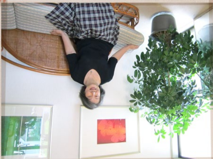
所長 (美しい版画を飾った明るい玄関で)